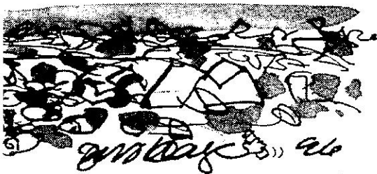
Tegning: Jens Hage

Kronikforslag må være 140 linjer à 60 anslag. Send gerne print med DOS-formatet diskette forsynet med programnavn til: Kronikredaktør Niels Houkjær Berlingske Tidende Pilestræde 34 1147 København K